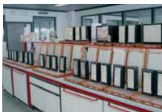
Prove presso il laboratorio Fassa Bortolo.

Un'attenzione alla qualità che oggi si concretizza nella nuova Linea Restauro EX NOVO, una gamma completa di prodotti a base di calce idraulica naturale NHL 3,5 e cocciopesto, caratterizzata anche da prodotti specifici per il risanamento di murature umide.