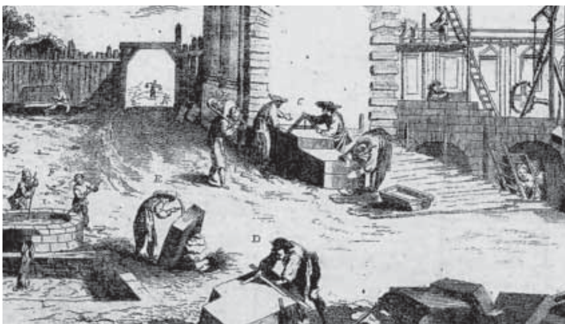
Incisione Anonima in F. Grisellini "Dizionario delle Arti e dei Mestieri", Venezia 1768-78, 18 voll.

“La scoperta di un legante a comportamento idraulico, atto cioè a far presa ed indurire anche in ambiente subacqueo, si fa risalire ai Fenici. (...) Ai Fenici si attribuisce la preparazione di malte confezionate con calce aerea e sabbia vulcanica delle Cicladi. Cisterne per acqua, intonacate con malte idrauliche, sono state rinvenute a Gerusalemme e si fanno risalire al regno di Salomone (X Sec. a.C.) e alla mano di operai fenici.