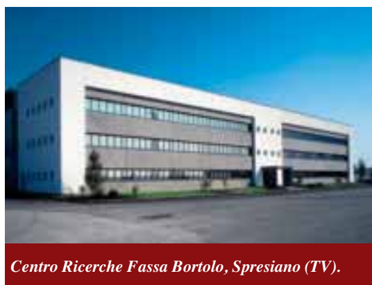
Centro Ricerche Fassa Bortolo, Spresiano (TV).

Un'attenzione alla qualità che oggi si concretizza nella nuova Linea Restauro EX NOVO, una gamma completa di prodotti a base di calce idraulica naturale NHL 3,5 e cocciopesto, caratterizzata anche da prodotti specifici per il risanamento di murature umide.