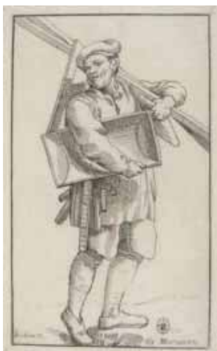
Incisione di A. Carracci in A. Carracci “ Arti, Mestieri e figure tipiche ”, tavola 65, Roma 1646.

P. Accinelli - La storia della calce . - 2008